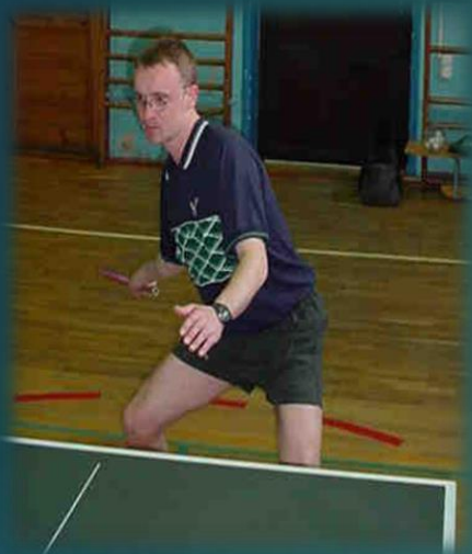
T - forehend