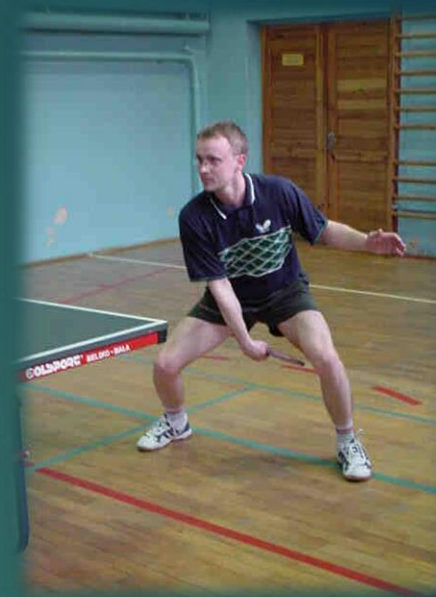
T - bekhend